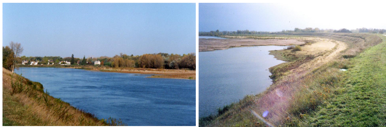
Vale do Rio Loire (Orléans)

Foi essa parceria existente entre os diversos usuários da água, coletividade, indústrias, agricultores, associações, que permitiu definir objetivos claros e realistas, apropriados a todos, e de instalar meios financeiros necessários para sua realização.