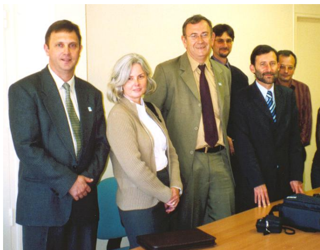
Reunião na Comunidade do Aglomerado de Niort