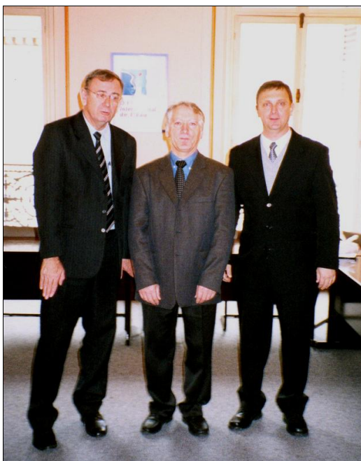
Visita ao Office International de l'Eau