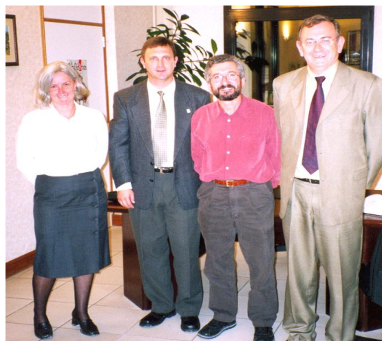
Reunião na Prefeitura de Affres