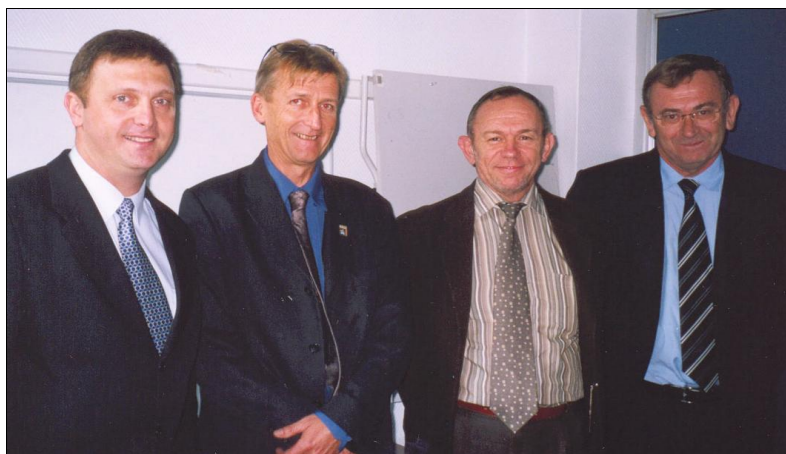
Reunião na Agência Seine-Normandie