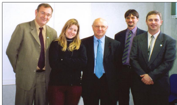
Reunião com SERTAD