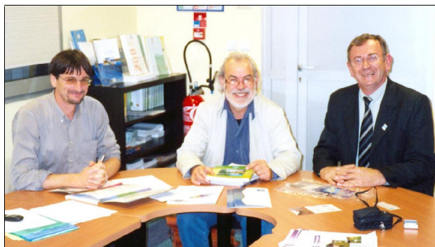
Reunião com GRAINE

A proposta ao TwinBasin visava não somente visita na sede da Agência Loire-Bretagne, mas também conhecer alguns projetos e ações implementadas com os recursos financeiros da Redevance , nas regiões de Poitiers e Niort, através de contratos com entidades regionais. Assim foram realizadas visitas e reuniões em prefeituras, conselhos regionais e associações e também visita aos Marais Poitevin.