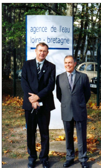
Visita à Agência de Água Loire-Bretagne

A fim de otimizar a viagem à Europa foram realizadas, também, reuniões e visitas técnicas na Espanha, junto à Direção Geral de Água, do Ministério de Meio Ambiente, à Confederação Hidrográfica do Tajo e à Infraeco, empresa que desenvolve projetos ambientais.