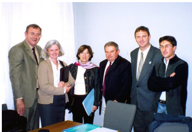
Reunião no Conselho Geral Deux-Sèvres

Os Marais Poitevin é segunda zona úmida da França, também conhecida como “Veneza Verde”. Essa importante região, cortada por inúmeros canais, é ocupada por pastagens de gado.