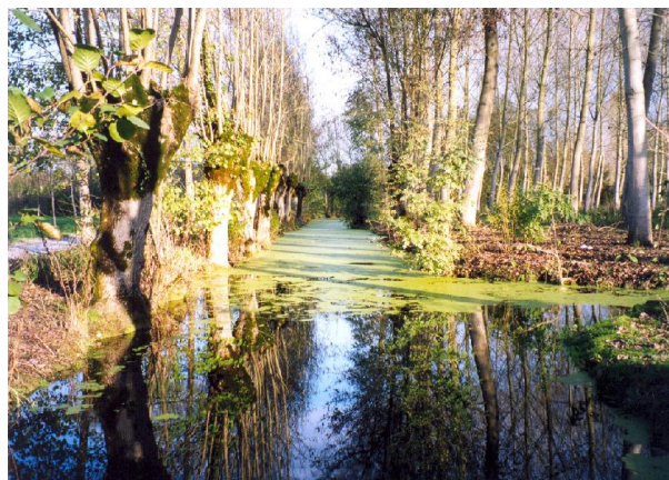
Região dos Marais Poitevin