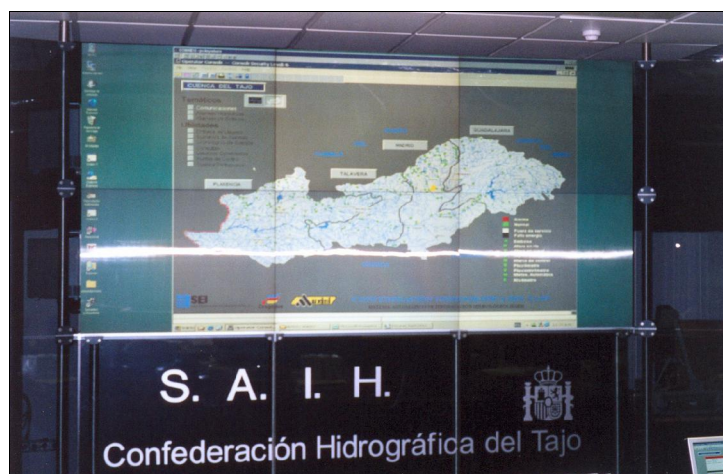
Panel de Controle – Confederação Hidrográfica do Tajo

(SSD), desenvolvido pelo LabSid, da USP e que os Comitês PCJ está adquirindo, com apoio do Consórcio PCJ, Sabesp e Fehidro.